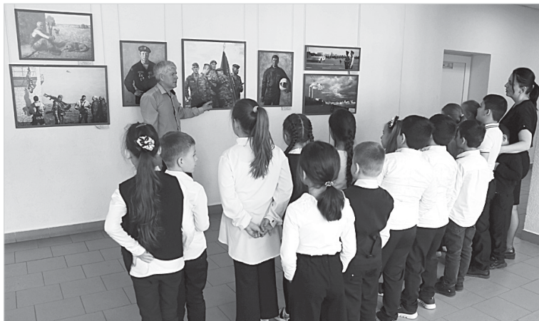
В школе № 22 идет музейный урок

В 2015 году Ставропольский музей изобразительных искусств совместно с Главным управлением МВД РФ по Ставропольскому краю организовал выставку «На службе Отечеству и народу», на которой также демонстрировались произведения, отображающие жизнь отряда специального назначения внутренних войск «Витязь». В процессе общения с бойцами спецподразделения у художника возникли идеи для