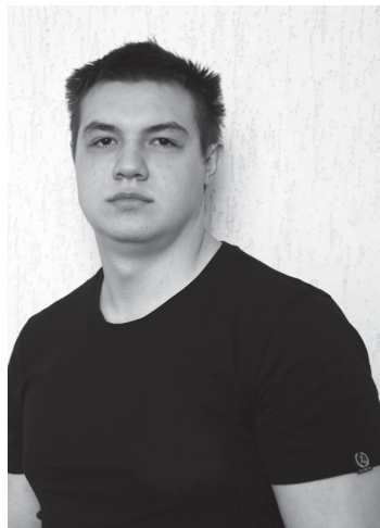
Даниил Терешин: «В армии должен служить каждый, кто считает себя мужчиной»